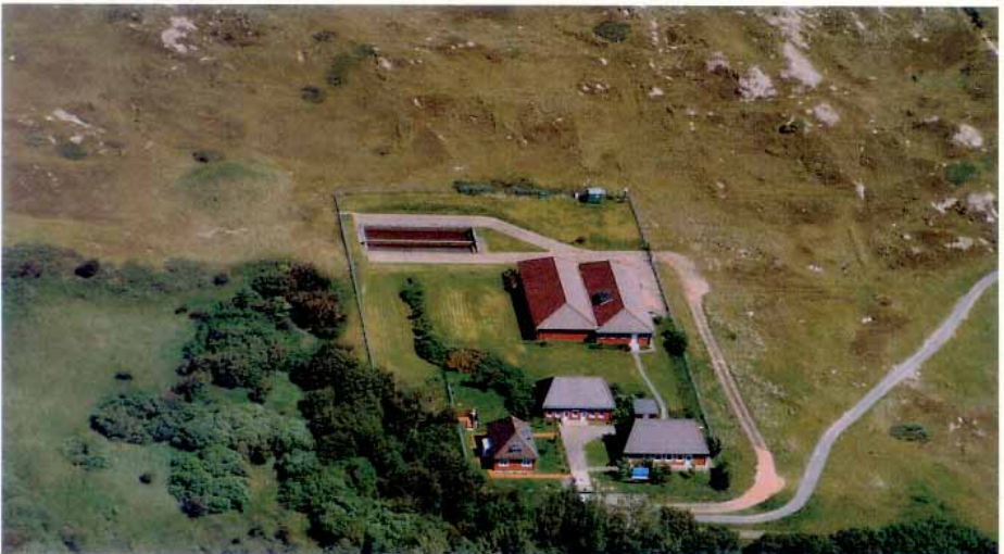
Wasserwerk II „Weiße Düne“