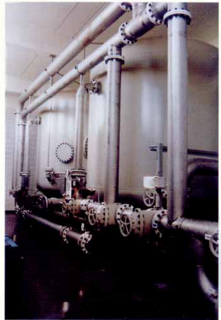
Geschlossenes Vorfiltersystem Wasserwerk II