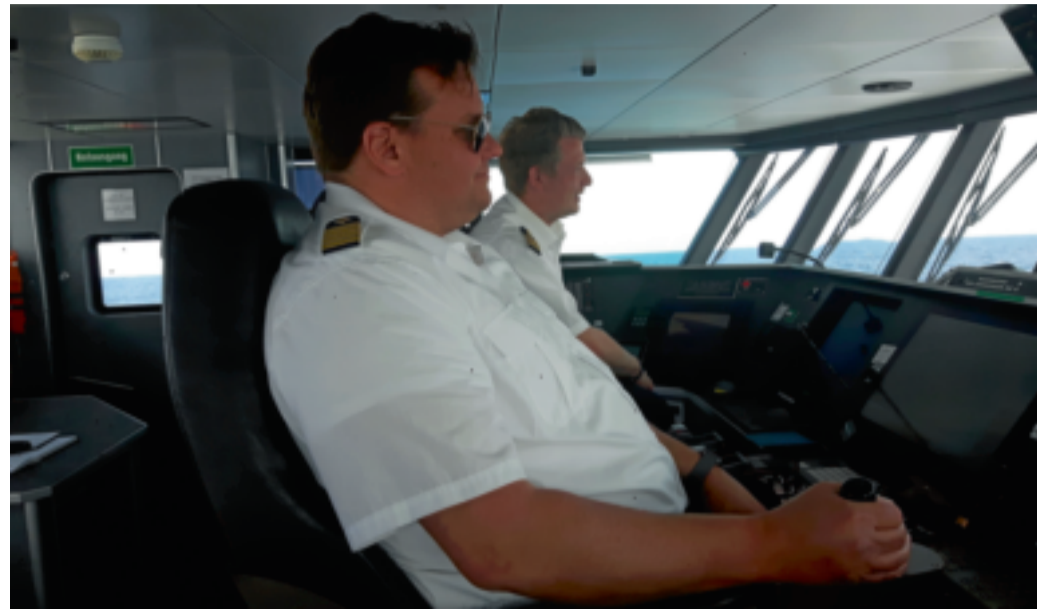
Blick auf die Brücke der „Adler Jet“.

Für Familien gibt es wieder die Familien-Tageskarte zum Preis von 187 Euro für zwei Erwachsene und bis zu drei Kindern. Weitere Informationen und Tickets gibt es unter www.inseltouristik.de oder an den Fahrkartenschaltern der Reederei und auf Norderney zusätzlich bei der DHL-Filiale in der HS2-Passage, Bülowallee 2.