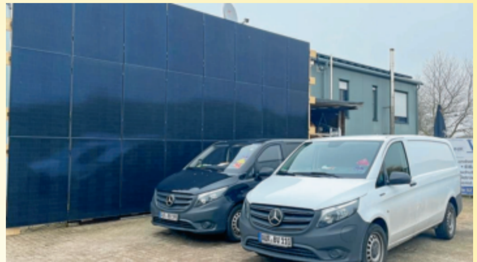
Auch im eigenen Haus wird bereits seit Jahren auf solare Technologien gesetzt.

• Wer Strom ins Netz einspeist, erhält dafür jetzt spürbar mehr als noch 2022. Die Erhöhung der Einspeisevergütung auf jetzt 8,2 Cent pro kWh (bei Anlagen bis 10 kWp) ist eine deutliche Ermunterung durch den Staat, jetzt umzurüsten. Auch die Mehrwertsteuer auf die Anschaffung der Anlagen ist weggefallen. In den kalten Monaten werden zudem naturgemäß weniger Solaranlagen verkauft als im Sommer, deswegen kann es Sinn machen, noch vor dem Frühling zu etwas