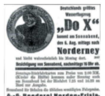
Anzeige im Ostfriesischen Kurier, 4. August 1932.

Am folgenden Tag verabschiedete sich das Flugboot mit einem Abstecher nach Borkum und 40 Personen an Bord wieder in Richtung