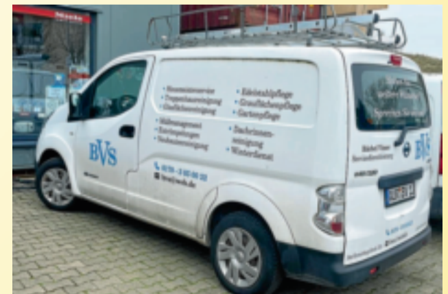
Auf Achse für den vollen Service rund ums Haus.

das Reinigen von Glasflächen. Entrümpelungen, die Pflege von Edelstahlelementen und Graufächern, die Gartenpflege, Dachrinnenreinigung und ein Winterdienst. Also nichts, was es nicht gibt. Sollten Kunden Wünsche haben, die nicht in die oben genannten Bereiche fallen, findet der BSV auch dafür garantiert eine Lösung. Nachfragen unter Telefon: 0170/30500022.