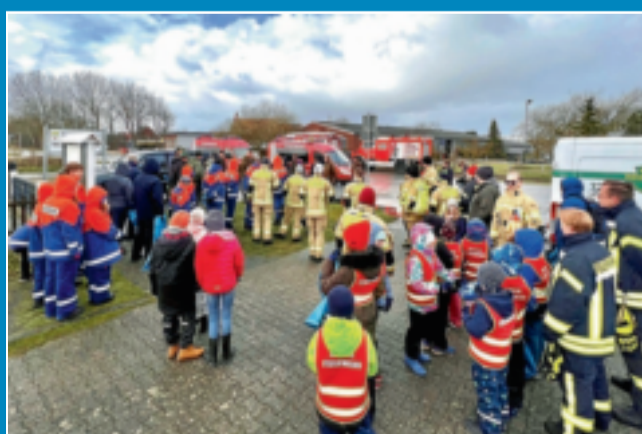
Hegering organisiert Reinigung