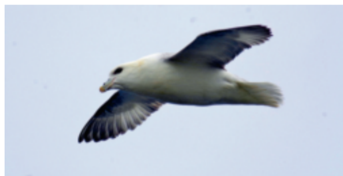
Ist einer Möwe ähnlich, aber mit dem Albatross verwandt.

Wenn sie nicht brüten, leben sie nur auf dem Meer