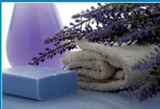
Lavendel-Spezial im Badehaus