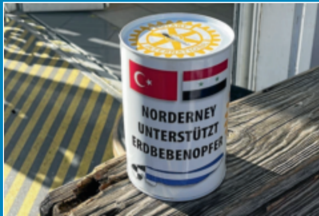
Rotary Club Norderney sammelt für Erdbebenopfer.