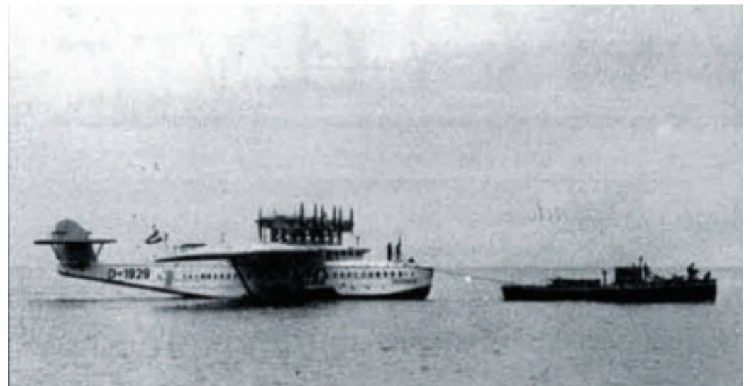
DO-X im Schlepp der Barkasse „Baldur“ der Flugstation Norderney.

Erst nach eineinhalb Jahren, am 24. Mai 1932, kehrte die DO-X nach Deutschland zurück – begrüßt von den Salut schießenden Küstenbatterien auf Borkum. Nach einer Ehrenrunde über die Seeflugstation Norderney erfolgte der Weiterflug nach Berlin. Mehr als 100 000 Berliner besichtigten das auf dem Müggelsee ankernde Flugzeug, welches am 23. Juni zum Deutschlandflug startete. Anfang August erwartete man die DO-X auf Norderney.