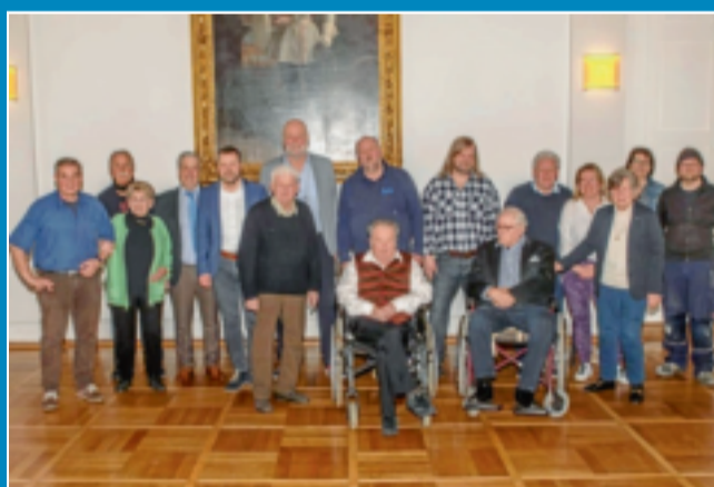
Elf Gewerke und 775 Meisterjahre