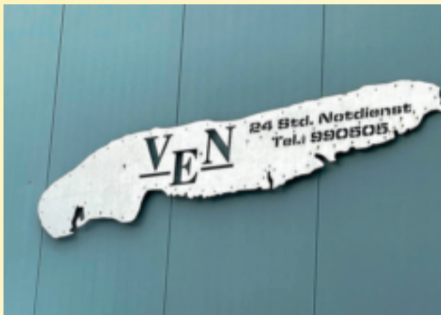
Auch ein 24-Stundendienst gehört dazu.

Dazu besteht auch morgen ab 10 Uhr die Möglichkeit. Hier allerdings ist dieser Jubiläumstag mit „Open-End“ geplant und auch sonst