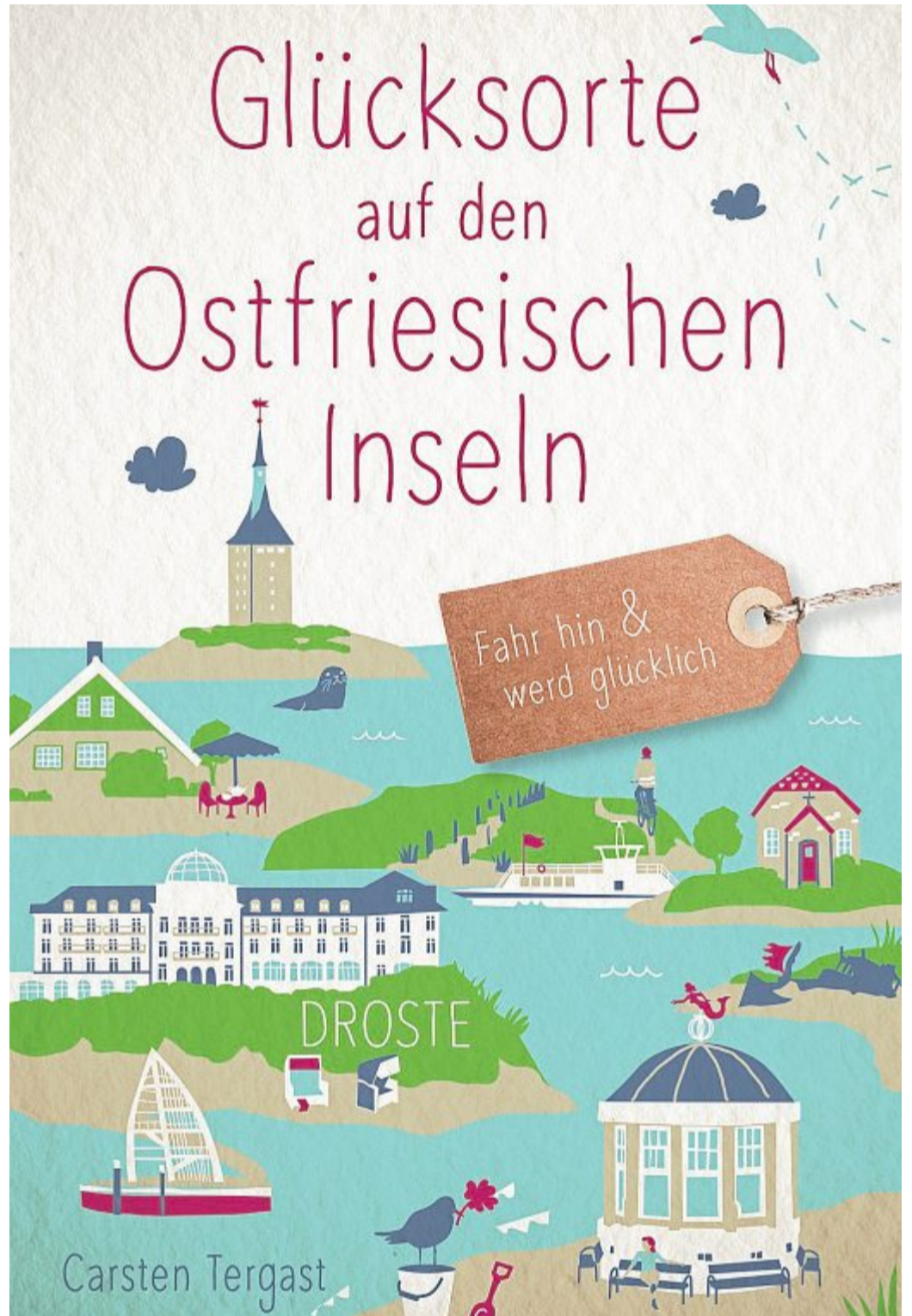
Insgesamt 80 „Glücksorte auf den Ostfriesischen Inseln“ hat Carsten Tergast für seinen besonderen Reiseführer ausgemacht.

Sieben Inseln auf einen Streich. Das Buch führt auf wirklich außergewöhnliche Weise über alle Ostfriesischen Inseln und ist eine gute Alternative zu den üblichen und damit normalen Reiseführern. Das Buch kostet 15,99 Euro. Eine Investition, die sich lohnt.