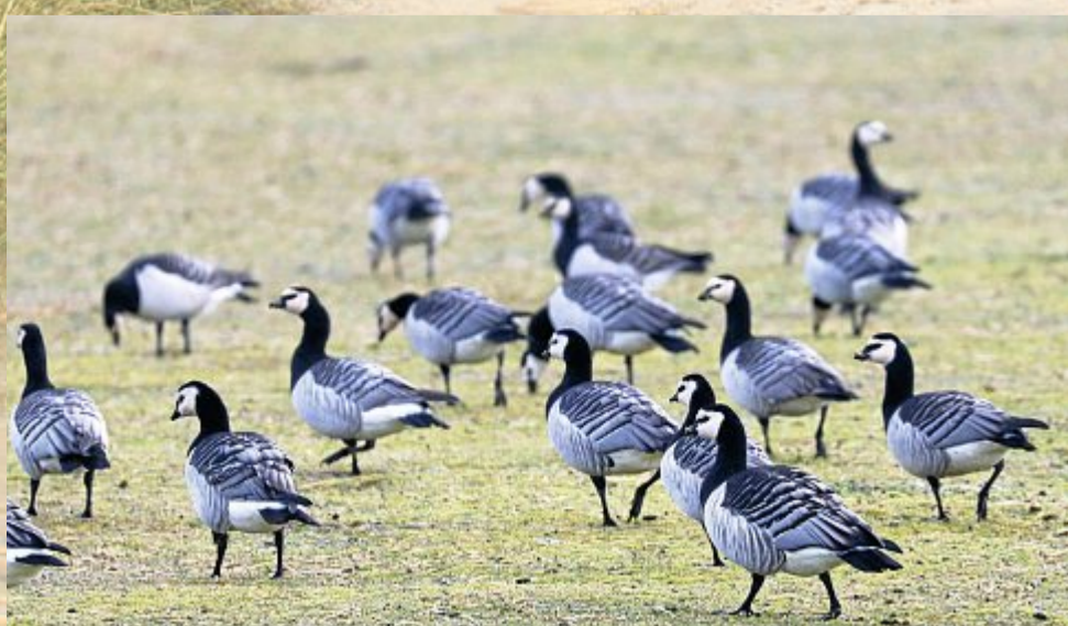
Nonnengänse fühlen sich auf Norderney heimisch. Nahrungsmangel gibt es keinen.