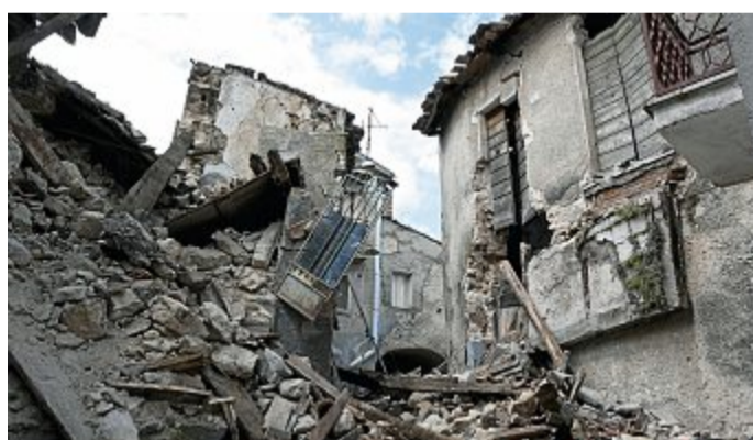
Rotary Club unterstützt Erdbebenopfer.