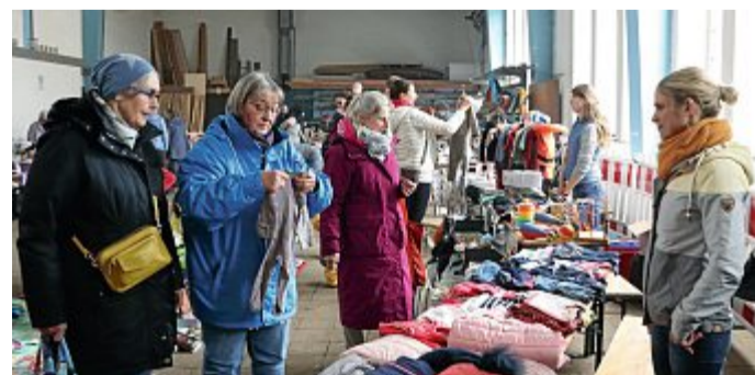
Groß war die Auswahl beim Basar der Inselzwerge.

Alle Standinhaber zeigten sich mehr als zufrieden, ebenso wie der Familienverein der Norderneyer Inselzwerge als Veranstalter vor Ort des Frühlingsbasars. akn