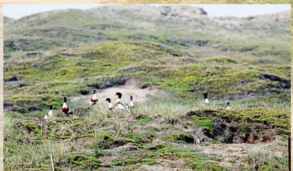
Die Brandgänse beobachten stets wachsam ihre Umgebung.