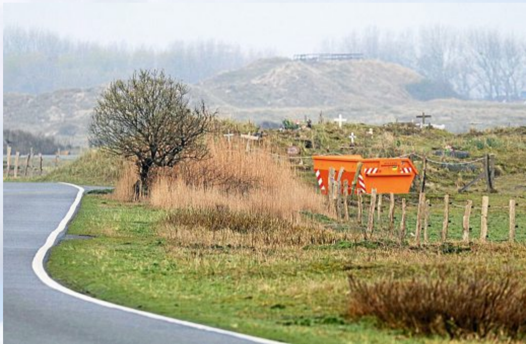
Ein oranger Container bringt Farbe in die noch triste Landschaft am Tierfriedhof.