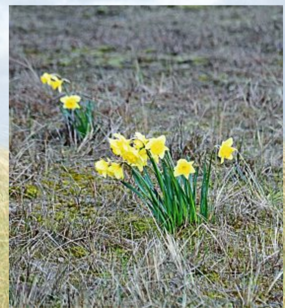
Verspätet zeigen die Osterglocken ihre Pracht.