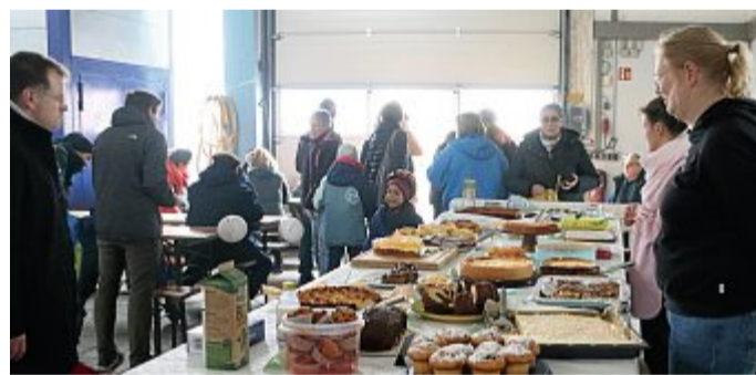
Das üppige Kuchenbuffet erfreute die Gäste.

Für Groß und Klein wurde wieder allerlei angeboten, vor allem natürlich Kinderkleidung, Spielzeug, Kuschtierchen und al-