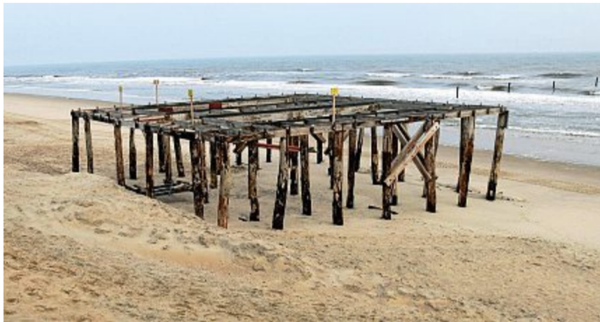
Nur noch ein Gerippe – die ehemalige Plattform.

Schon im Vorfeld hatte das Staatsbad auf Anraten den Bauantrag modifiziert und dabei auf Container für Kiosk als auch Schließfächer verzichtet (wir be-