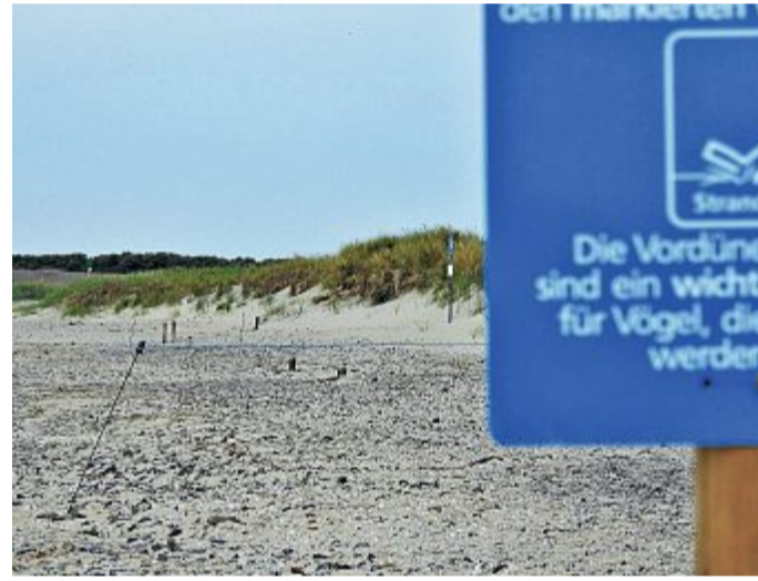
Auf den Ostfriesischen Inseln markieren Nationalpark-Ranger die Brutgebiete mit Schildern und mobilen Zäunen.