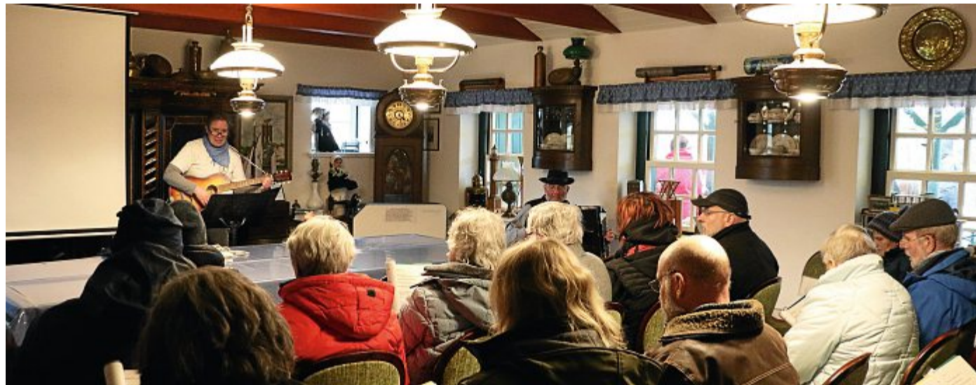
Auch das schlechte Wetter konnte den Organisatoren und Gästen nicht die Stimmung verhaseln.

Um 12 Uhr ging es dann endlich los und bei zunächst noch trockenem Wetter kamen auch viele Besucher in das urige Wäldchen. An verschiedenen Kreativ- und Flohmarktständen gab es reichlich zu bestaunen und natürlich auch zu kaufen. Über den ganzen Tag hinweg hatten die helfenden Hände des Heimatvereins Norderney ein abwechslungsreiches Programm zusammengestellt.