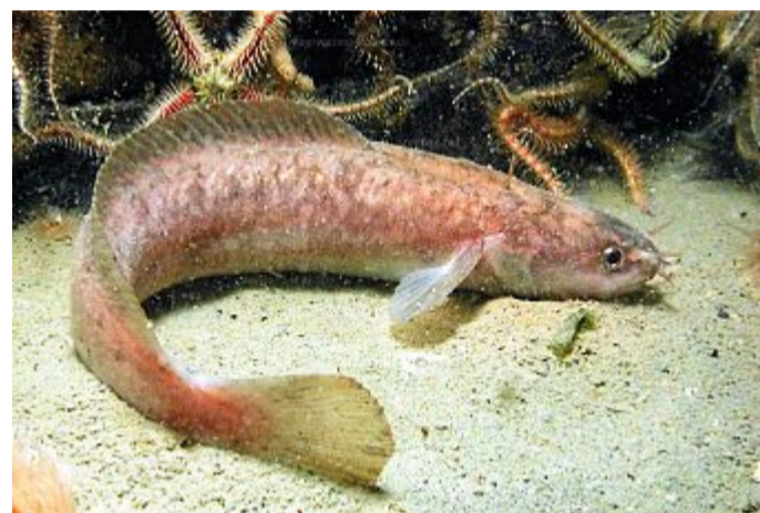
Die Fünfbärtelige Seequappe.

richten zu können. Leicht zu erkennen ist die Seequappe an ihrem langgestreckten Körper. Sie hat meist eine braun bis goldene Färbung und wird zwischen 15 und 30 Zentimetern lang. Der schlanke, schlangenartige Körper hilft ihr, in Küstennähe Verstecke zu finden. Der sandige und steinige Boden der Nordsee ist ihr Lebensraum, dort sucht sich die Seequappe Verstecke, wie Höhlen oder Vorsprünge. Diese verlässt sie nur selten und verteidigt sie; man sagt, sie ist territorial. Bei Gefahr wird sie aufgeregt und lebhaft. Generell mögen es Seequappen eher warm,