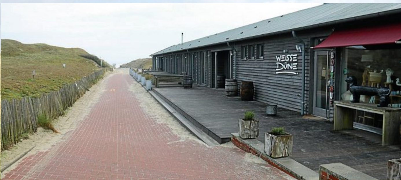
Noch herrscht an der Weißen Düne die Ruhe vor dem Sturm.