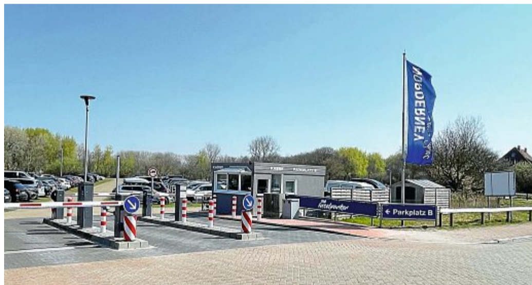
Nun mit einer vernetzten Schranke: der Parkplatz B an der Feldhausenstraße.

Gerade in der vergangenen Sommersaison waren die Parkplätze B und C mitunter stark frequentiert und es bildeten sich zum Teil längere Wartebereiche vor der Einfahrt. Deshalb kann das neue Angebot sicher überzeugen.