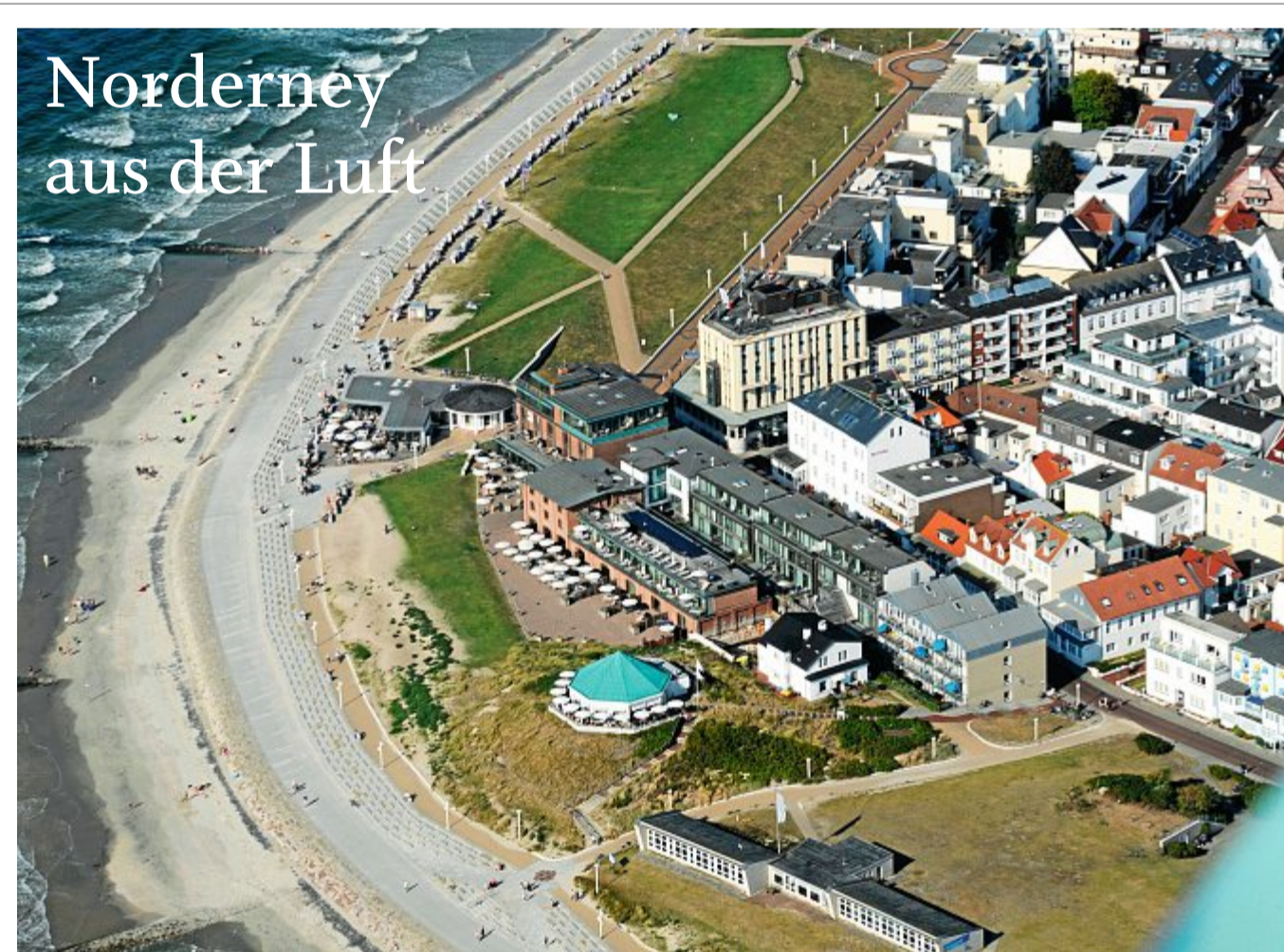
Das Foto stammt aus August 2022, die Bestellnummer lautet 2316.

mich sehr schwer vorstellbar. Dann mache ich mich jetzt mal wieder auf meinen nächsten Rundflug über das Meer und denke an die unzähligen Lebewesen, die unter mir in diesem interessanten Lebensraum der Nordsee wohnen! Bis nächste Woche, Euer Kornrad