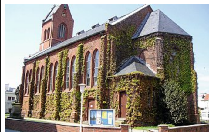
Am Sonntag ist Konfirmation in der Inselkirche.