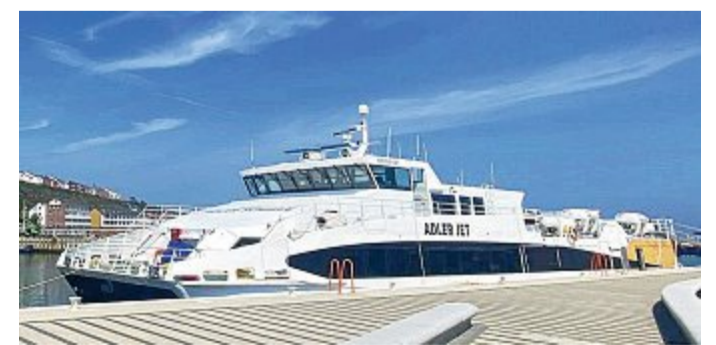
Die „Adler Jet“ an der Helgolandpier.

Der Aufenthalt auf der Hochseeinsel Helgoland beträgt samstags, sonntags und dienstags rund vier Stunden. Jeder Montag ist mit rund fünf Stunden Zeit auf der Insel der „XL-Montag“. Danach geht es jeweils zurück Richtung Norderney und Norddeich. Neu ist, dass auf dem