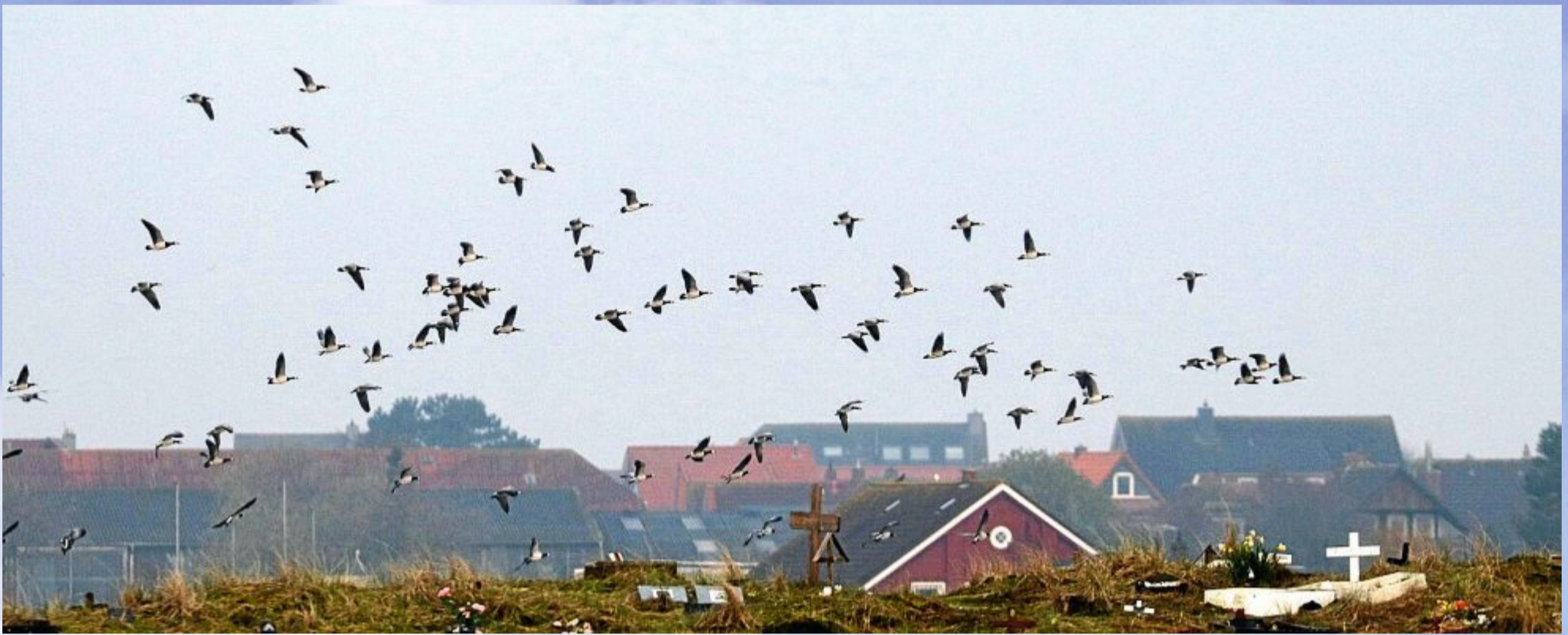
Die Nonnengänse sind eigentlich Zugvögel, bleiben aber vermehrt hier.