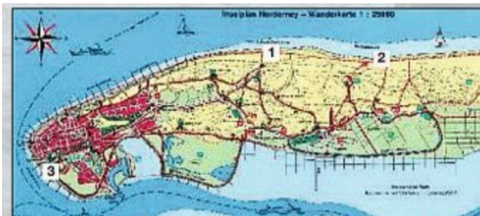
An den separaten Strandabschnitten dürfen Hunde an der Leine an den Strand.

ne. Aber keine Regel ohne eine kleine Ausnahme: Auf der Wiesenfläche des „Alten Fliengerhorstes“ hinter dem Westdeich dürfen die Vierbeiner ganzjährig ohne Leine herumtollen und toben.