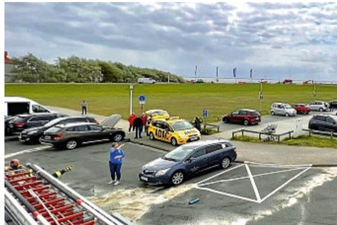
Gut zu sehen, wo Bindemittel auf einer Ölspur verteilt wurde

Am Mittwoch dann begann der Tag mit einer ausgelösten Brandmeldeanlage im Hotel Jann in der Halemstraße. Ein Grund für das Reagieren des sensiblen Geräts konnte jedoch nicht