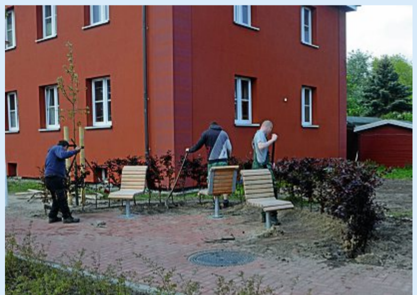
Auch die letzte Rotbuchenhecke steht bereits.

Linker Hand, wenn man von der Jann-Berghaus-Straße kommt, findet man in der Mühlenstraße jetzt drei Einbuchtungen mit je drei drehbaren Sitzgelegenheiten, die sich harmonisch in das Bild einpassen. Eine dieser Buchten findet