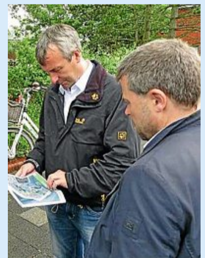
Der Staatssekretär im Bundesinnenministerium, Johann Saathoff (l.) und Bürgermeister Frank Ulrichs schauen auf die Baupläne der Maßnahme.

Die Kommune bekommt für die Fördermaßnahme „Grünes Quartier Mühlenallee“ 1,455 Millionen Euro vom Bund, die gesamte Maßnahme kostet 4,6 Millionen Euro.