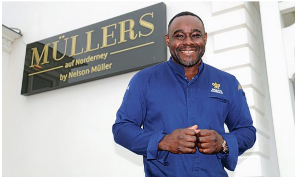
Sternekoch Nelson Müller vor seiner neuen Lokalität im Hotel „1884“.

Nach den Standorten in Essen und der Burg Schwarzenstein im Rheingau ist Norderney der dritte Standort für das „Müllers“. „Ich war vor einem Jahr das erste Mal auf Norderney und habe mich sofort in die Insel verliebt. Durch meine Lehrzeit auf Sylt habe ich schon früh die Nordsee lieben gelernt. Norderney ist allerdings etwas ganz Besonderes. Die Menschen hier und das Lebensgefühl haben mich eingenommen. Hier fühle ich mich wohl. Mit den Betreibern des Hotels 1884 habe ich zudem tolle Partner gefunden. Zusammen wol-