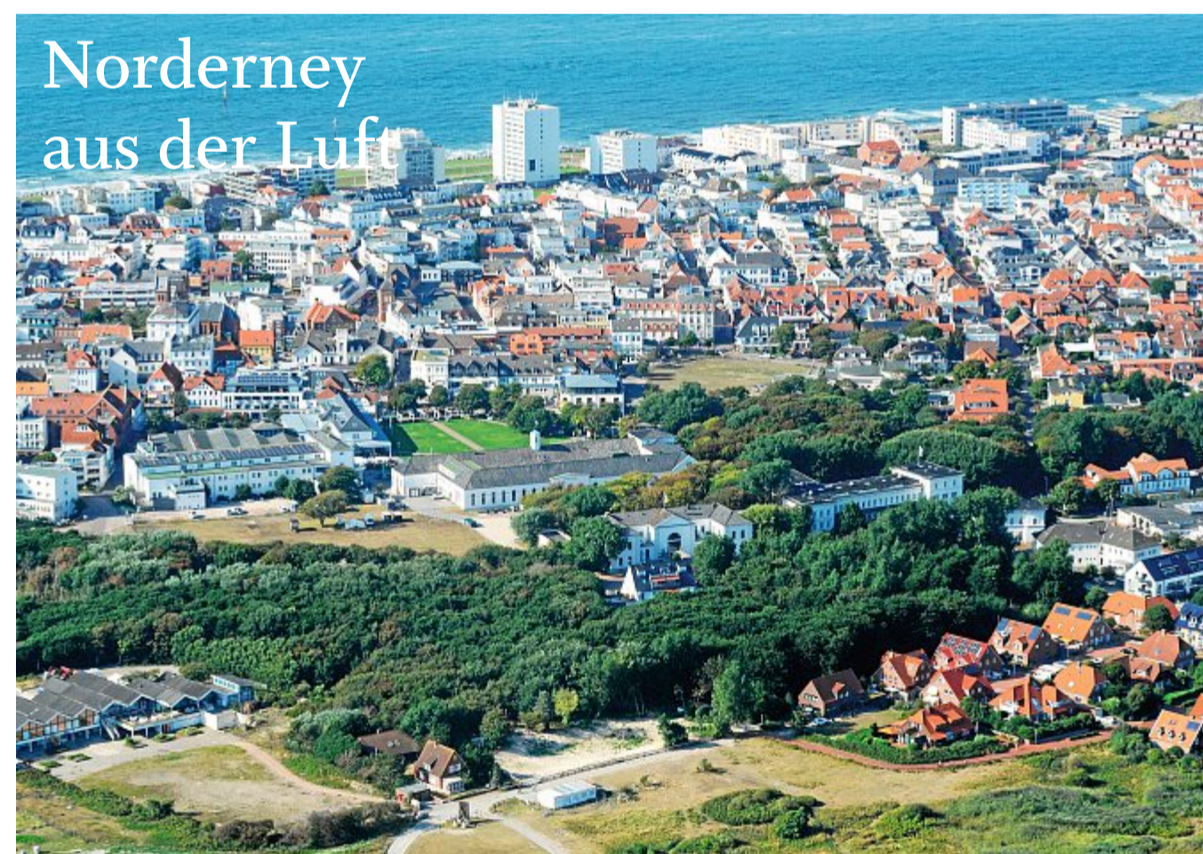
Das Foto stammt aus August 2022, die Bestellnummer lautet 2321.

ren können. Deshalb werden auch meist die Eikapseln aus fernen Gewässern an die Küsten der Nordsee gespült, wo wir sie dann als tollen Strandfund einsammeln können. Ein wirklich sehr interessantes Tier. Ich freue mich schon, euch von noch vielen mehr zu berichten. Bis nächste Woche, Euer Kornrad