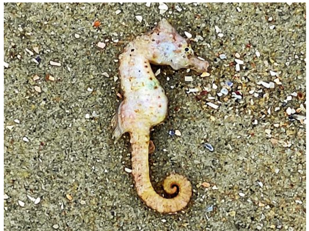
Gefunden wurde am Strand von Norderney in der vergangenen Woche dieses Kurzschnäuzige Seepferdchen.

Die Seepferdchen werden zusammen mit den Funddaten in die wissenschaftliche Sammlung des Landesmuseums Natur und Mensch aufgenommen. So stehen sie für die Forschung zur Verfügung.