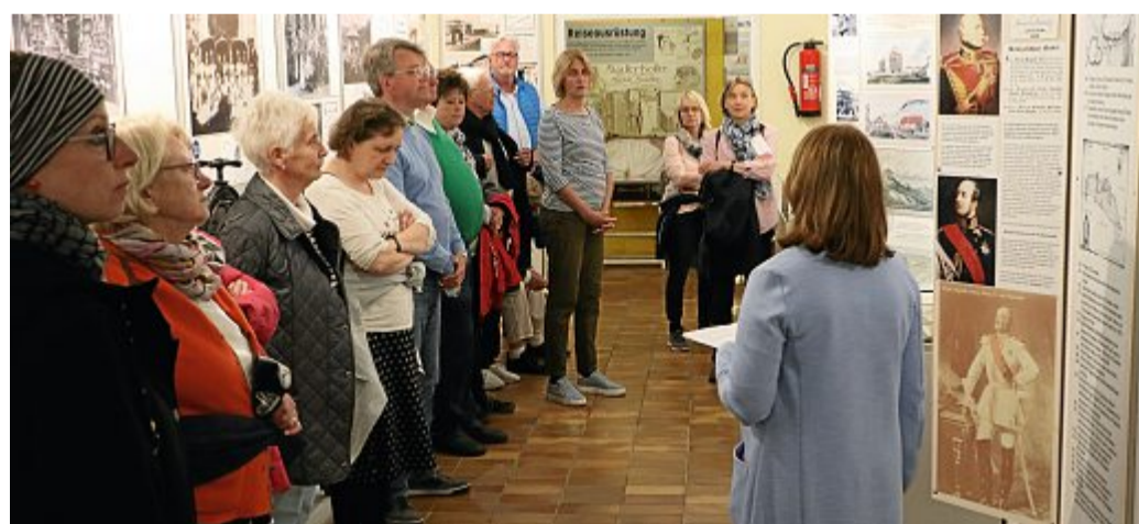
Bei verschiedenen Führungen und Vorträgen konnten die Besucher viel Interessantes über die Insel Norderney erfahren

Der Internationale Museumstag findet großen Anklang