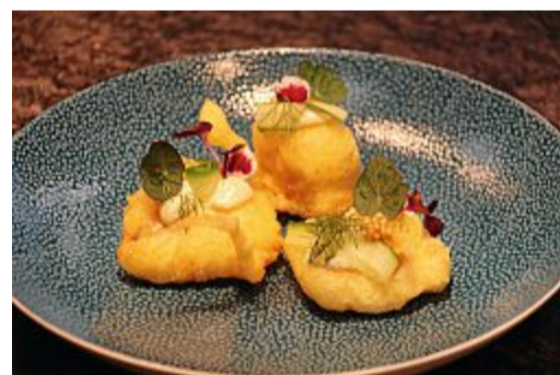
Backfisch-Kreation von Nelson Müller.