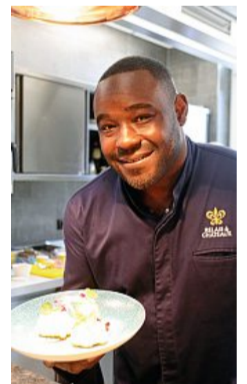
Küchenchef Nelson Müller.