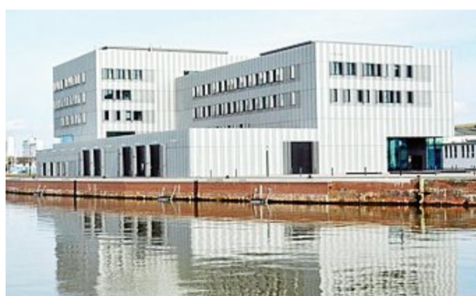
Das Thünen-Institut für Seefischerei in Bremerhaven.

Weitere Informationen und das Fundformular sind auf der Seite des Landesmuseums zu finden: www.naturundmensch.de/engagement/citizen-science/ .