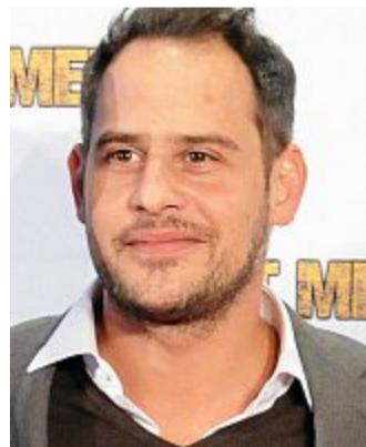
Moritz Bleibtreu erhält den Emdener Schauspielpreis.