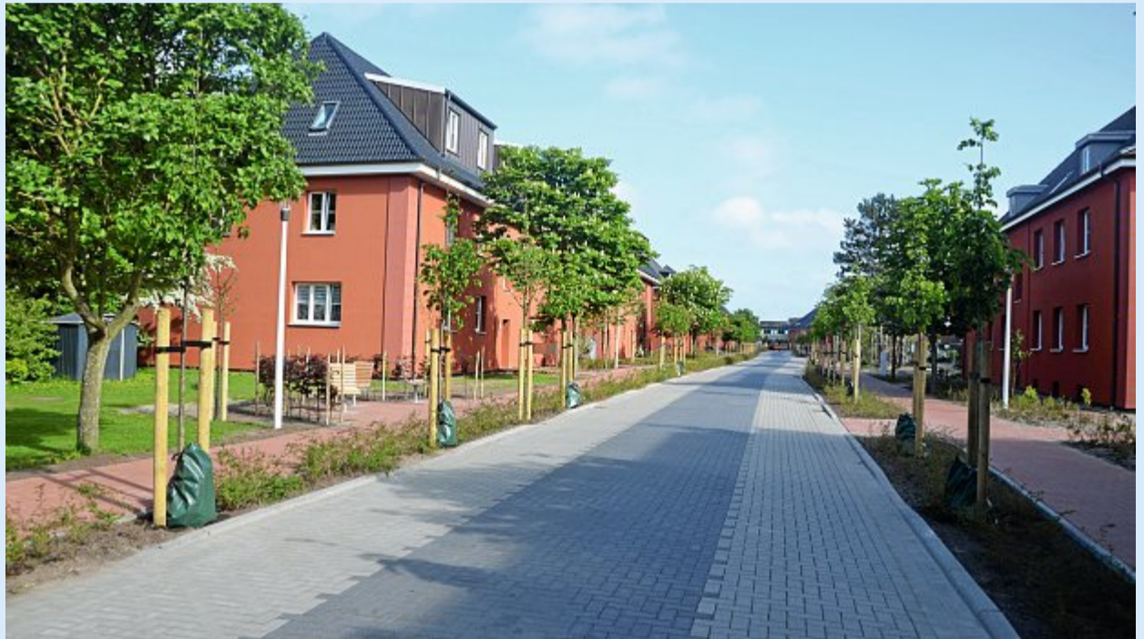
Klare Linien, aber auch wohnliches Ambiente: Durch die Baumaßnahmen hat die Mühlenstraße viel gewonnen.

Die Umsetzung ist ein Gewinn für Norderney