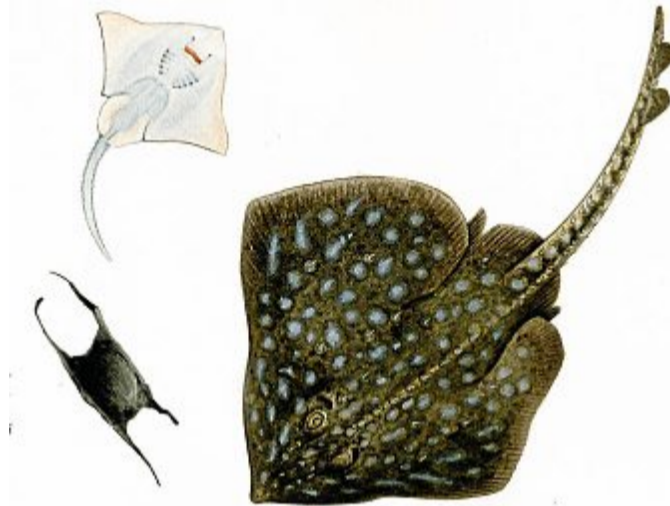
Der Nagelrochen. Links sieht man die Eikapsel.

In der Nordsee ist er zu einem seltenen Besucher geworden